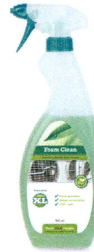
FOAM CLEAN Geconcentreerde schuimreiniger en ontvetter. Voor het verwijderen van lichte vervuiling.