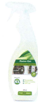
PROTEC GEL Aanbrengen na reiniging op kruiswisselaar. Zorgt voor een langdurige bescherming.