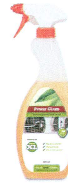
POWER CLEAN Geconcentreerde schuimreiniger en ontvetter van hoog niveau. Voor het reinen van zware vervuiling.